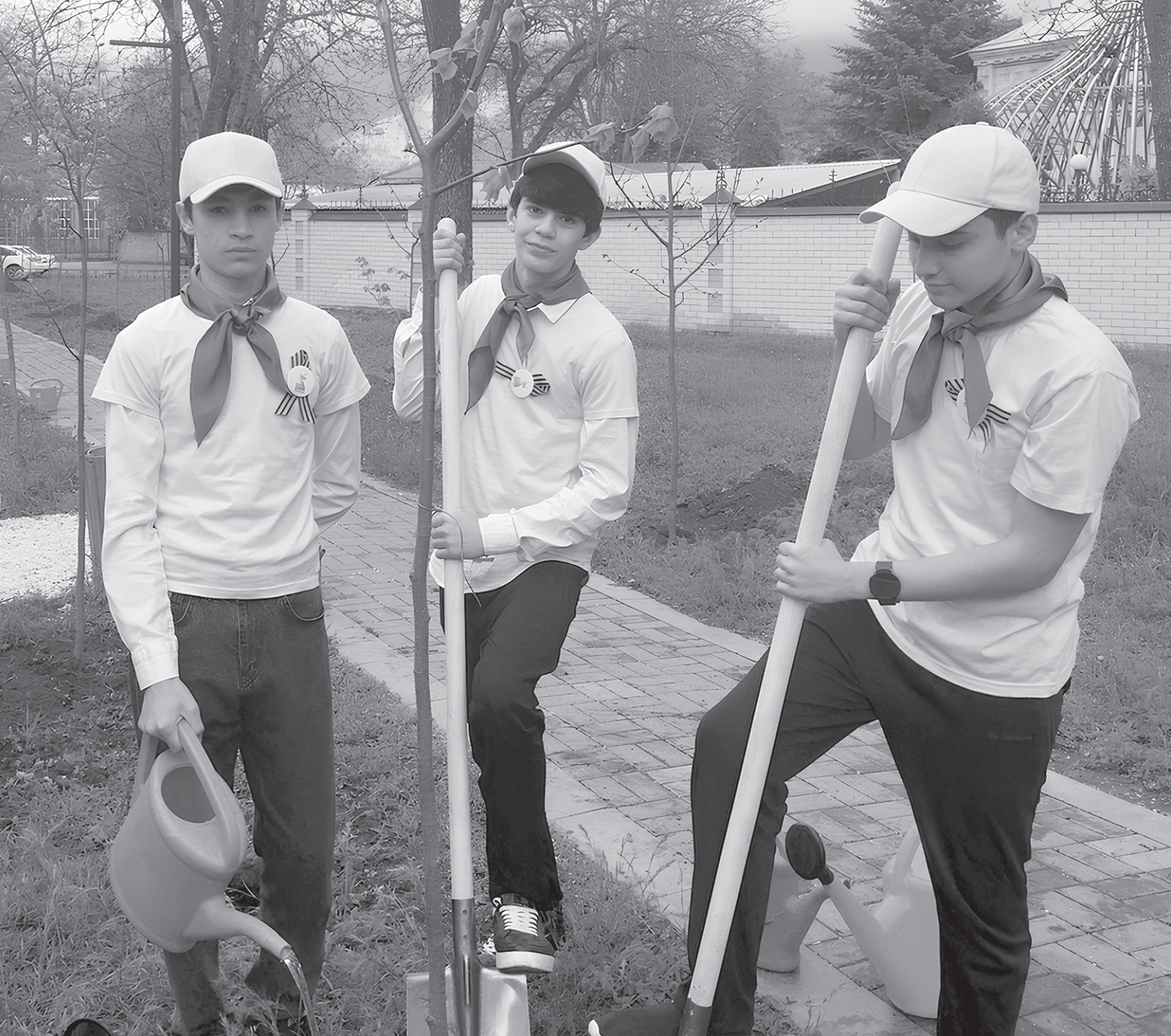
Учащиеся-волонтеры приняли активное участие в акции

Актуально В центральном парке города Усть-Джегуты 21 апреля учащиеся-волонтеры лицеев № 1 и № 7, школ № 2 и № 3 в рамках Международной акции «Сад памяти» провели церемонию высадки «Аллеи защитника Отечества». Организатором мероприятия выступила Карачаево-Черкесская республиканская организация общероссийского профсоюза образования.