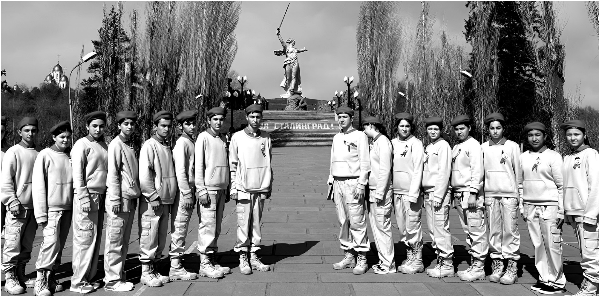
Учащиеся СОШ № 5 Усть-Джегуты на Мамаевом кургане