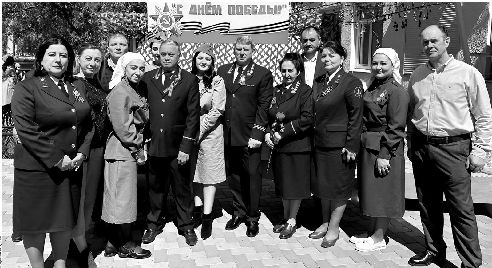
Работники Карачаевского районного суда проводят большую работу по патриотическому воспитанию среди населения

Еще больше интересного и нового на сайте denresp.ru